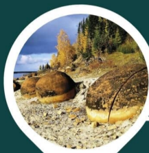
СФЕРИЧЕСКИЕ ГАЛФЕЕВСКИЕ КАМНИ Д. МАЛОЕ ГАЛОВО