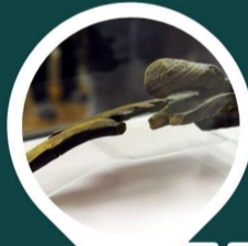
ФРАГМЕНТ «ЛЫЖИ ЙИРКАПА» НАЦМУЗЕЙ КОМИ