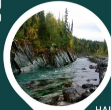
НАЦИОНАЛЬНЫЙ ПАРК "ЮГЫД ВА"