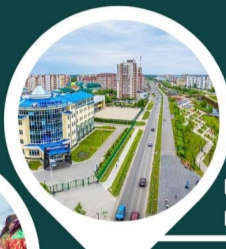
Г. УХТА - РОДИНА ПРОМЫШЛЕННОЙ НЕФТЕДОБЫЧИ РОССИЙСКОЙ ИМПЕРИИ