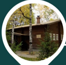
ДОМ-МУЗЕЙ И. П. МОРОЗОВА