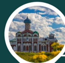
КЫЛТОВСКИЙ КРЕСТОВОЗДВИЖЕНСКИЙ МОНАСТЫРЬ